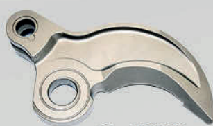
SJ - MS250