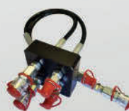
MM20 - MM30