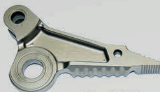
SJ - CS350