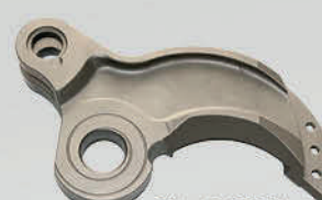
SJ - GS170