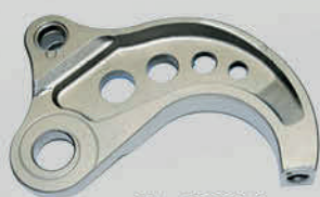
SJ - CC300